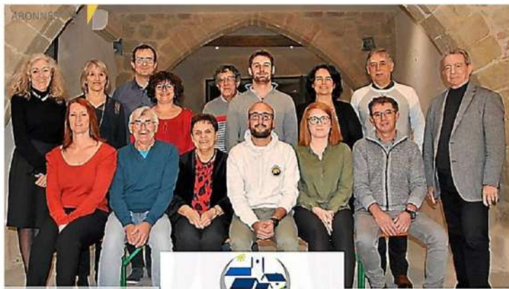
▲ La liste pour "Azille Conjuguons nos talents" ●