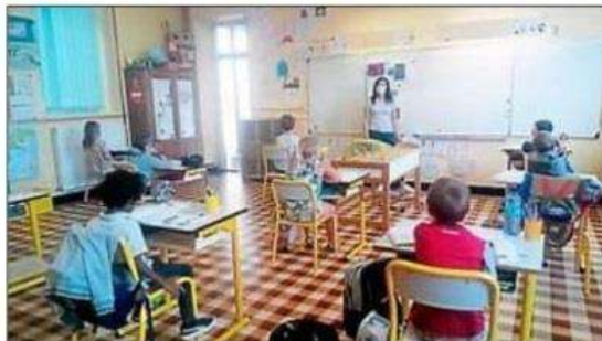
▶ Des groupes de niveaux ont été constitués à l'école primaire.

Depuis le 25 mai, c'est une reprise progressive sur la base du volontariat qui s'est opérée dans les écoles maternelle et élémentaire d'Azille, encadrée par un protocole sanitaire strict, mis en œuvre en étroite collaboration avec la municipalité et l'équipe des ensei-