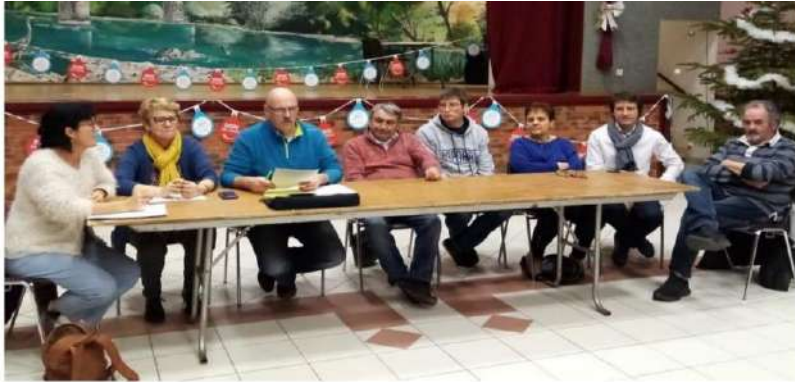
▲ Assemblée générale de l'association du Don de sang Azille. ●