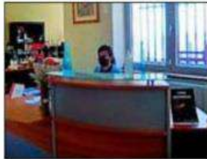
► L'accueil du public.

Des mesures sanitaires et de nouveaux aménagements dont le comptoir équipé d'un plexiglas, ont été réalisés pour éviter la