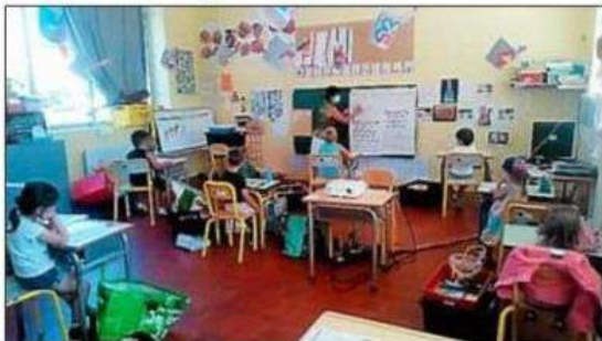
▶ A l'école maternelle, chaque élève a son espace.