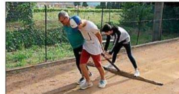
▶ Les jeunes du village ont été mobilisés pour venir aider à préparer les terrains pour la prochaine saison.

Tous espèrent débiter très prochainement les concours de pétanque à la mêlée et ce dès que la Fédération française de sports boules aura donné son feu vert.