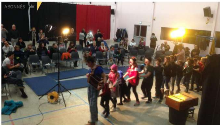
▲ Les écoliers en action !