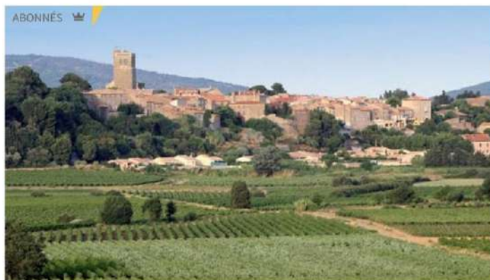
▲ Le village.

La commune se mobilise pour ses administrés