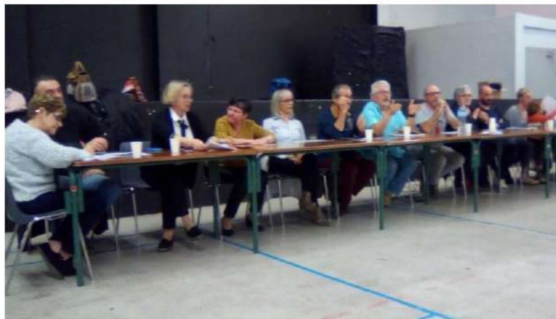
▲ Les candidats de la liste Azille ensemble.

Azille ensemble, en réunion publique vendredi dernier