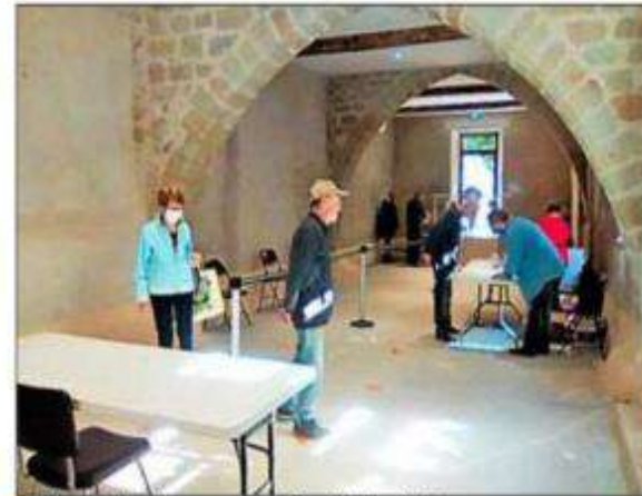
► Distribution des masques à la salle des Voûtes.

Pour lutter au mieux contre la propagation du virus, les élus se mobilisent en distribuant des masques en tissus aux habitants, mercredi 20 mai de 10 à 12 heures à la salle des voûtes en précisant les recommandations d'utilisation et d'entretien.