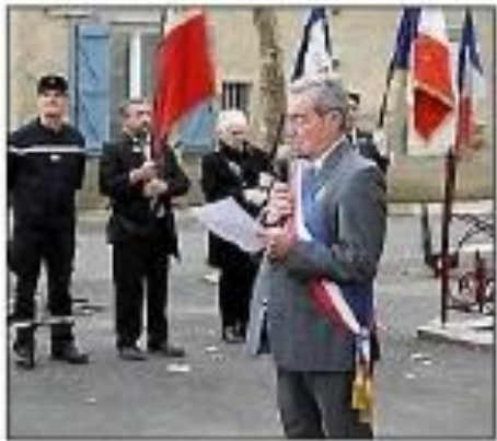
Une cérémonie en mémoire des disparus.

C'est par une belle journée ensoleillée que les habitants sont venus en nombre à la commémoration du 11-Novembre. Le cortège s'est rendu au cimetière pour un premier hommage aux morts