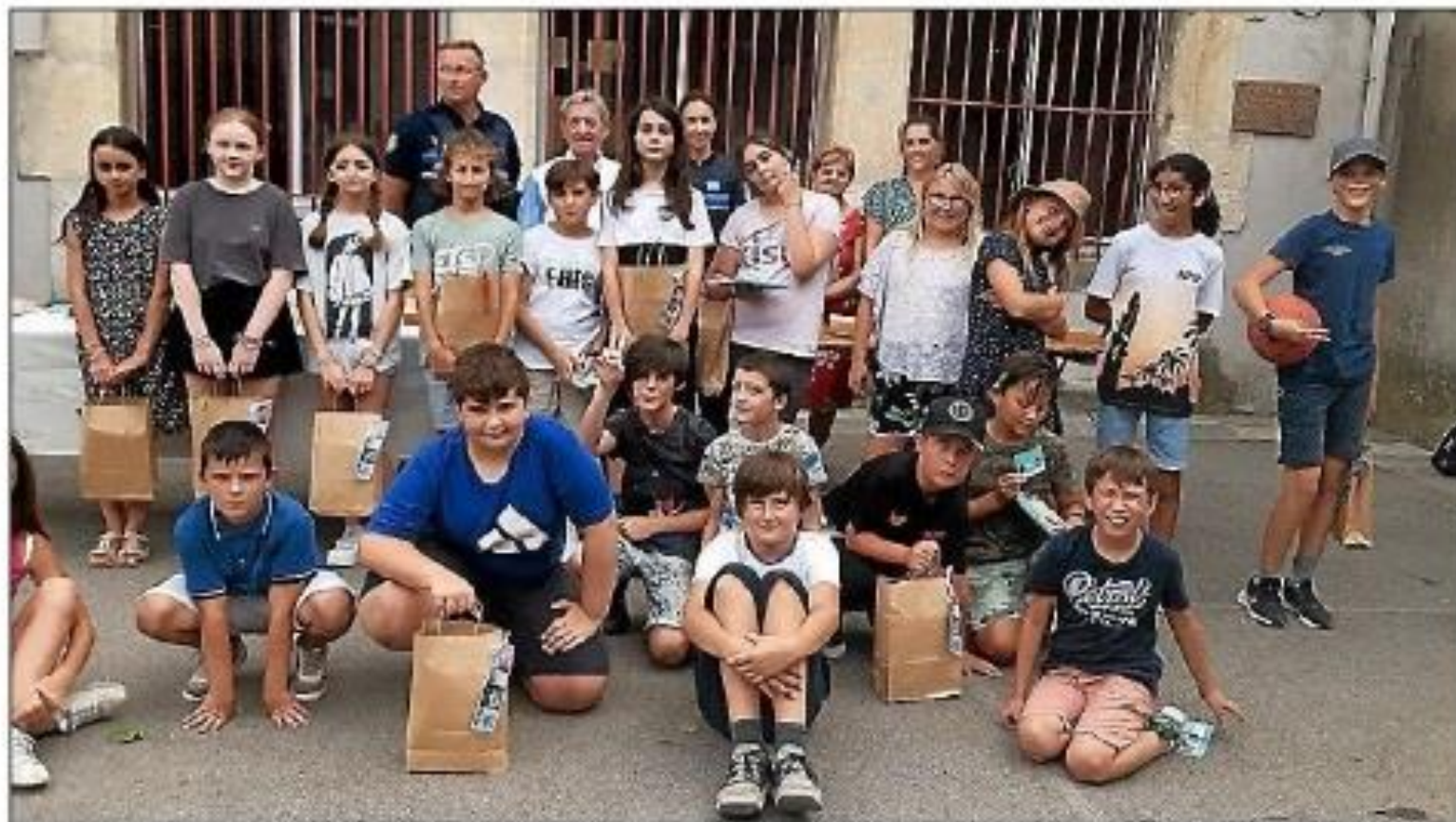
Les CM2 de l'école élémentaire d'Azille.

Cette cérémonie s'est conclue autour d'un goûter offert par la municipalité.