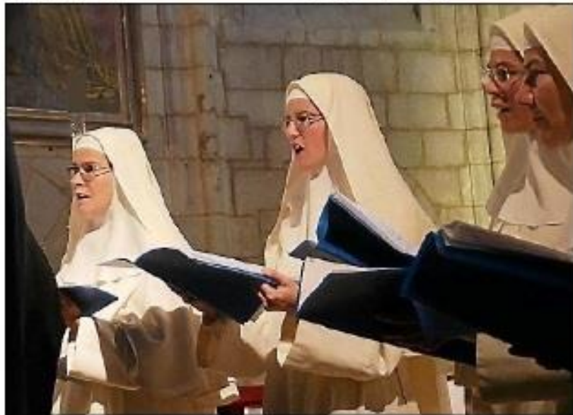
Les sœurs d'Azille interpréteront des chants de Noël.

L'entrée est gratuite. Le concert sera suivi d'un moment convivial autour d'un vin chaud. Pour tout renseignement complémentaire, on peut contacter le 04 68 49 54 27.