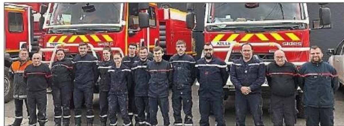
Les sapeurs-pompiers à Azille.

Un stage de formation d'équipes feux de forêts s'est déroulé du 2 au 4 mars au centre de secours.