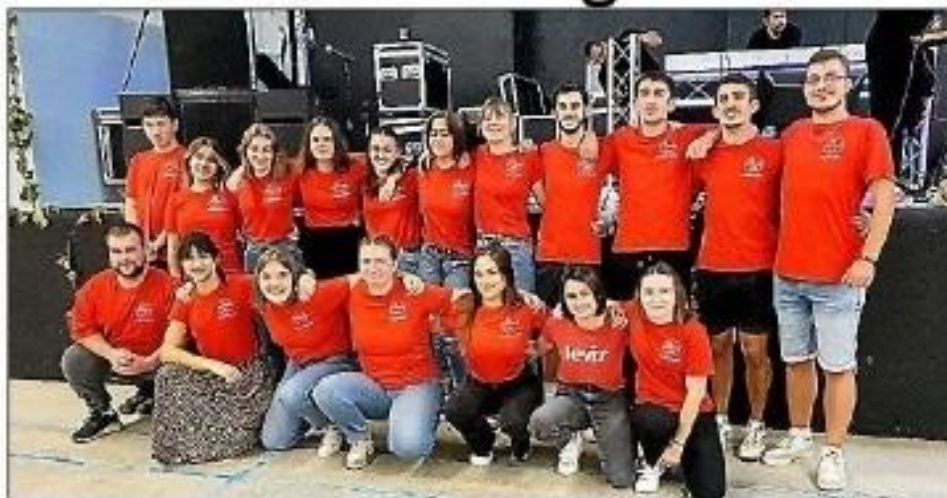
Comités des fêtes azillois.

La municipalité remercie l'ensemble des bénévoles pour cette initiative.