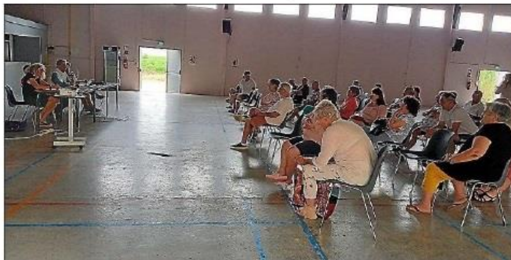
Deux grandes mesures citoyennes ont été adoptées en accord avec l'assemblée.

La municipalité met donc en place une phase expérimentale de 6 mois : extinction de minuit à 6 heures pendant les mois de juillet, août et septembre et de 23 heures à 6 heures pendant les mois d'octobre, novembre et décembre. Ces dispositions souffriront d'une exception les jours de manifestations sportives ou festi-