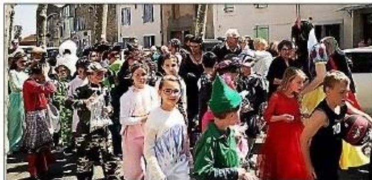
Les enfants d'Azille qui défilent dans les rues du village.

Bravo à tous pour ce moment de fête au village.