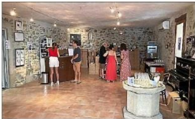
Lors de l'inauguration de l'extension de la cave du château Guéry.

Afin de fêter la fin des travaux de l'extension de la cave qui permettront au domaine du château Guéry d'améliorer ses vinifications et l'élaboration de ses cuvées, Florence et René-