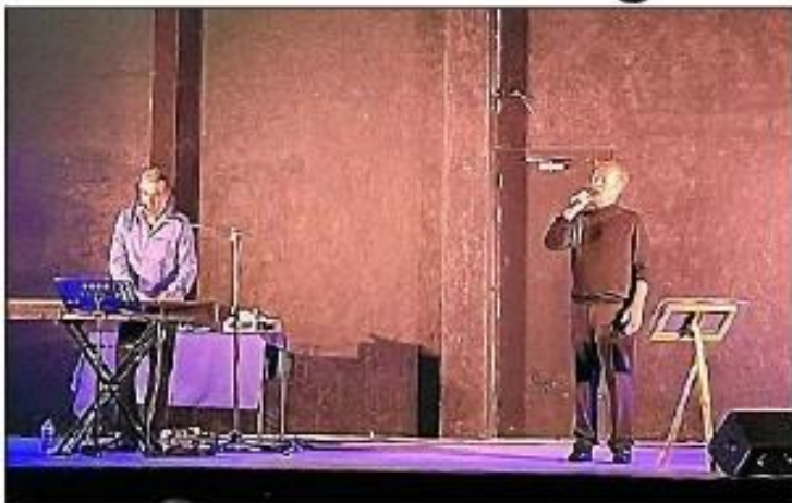
La troupe À tout bout chant.

Dernièrement a eu lieu la soirée Les amis de Georges. Beaucoup d'habitants étaient au rendez-vous. Le spectacle a duré environ deux heures mais aurait pu se prolonger toute la nuit tant que la passion était présente.