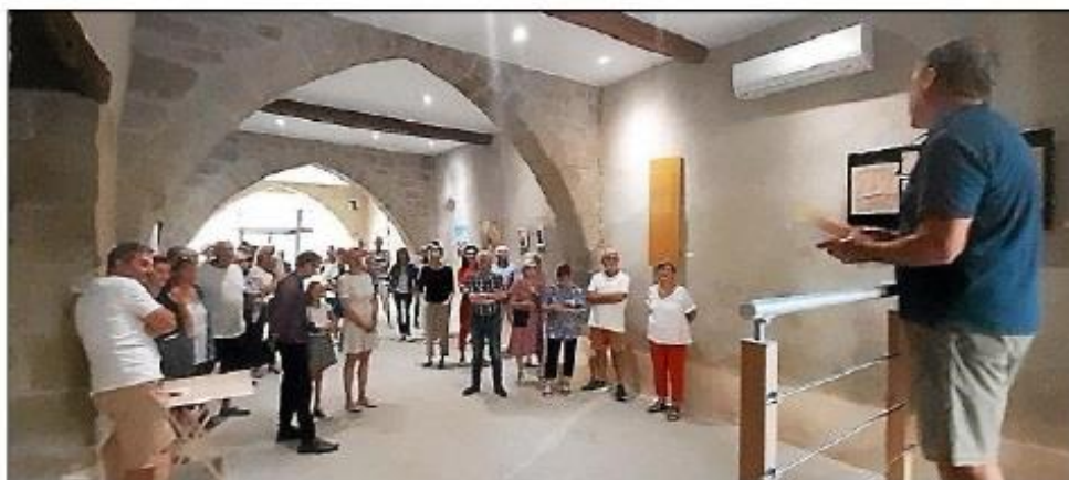
La salle des Voûtes accueille l'exposition jusqu'au 7 octobre.