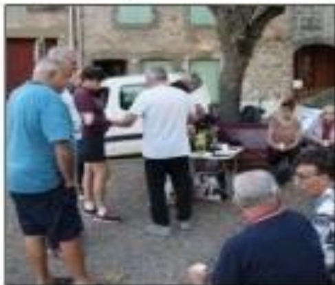
Les membres de Radio platane.

Cela fait longtemps qu'elle existe, mais elle n'avait pas encore officialisé son nom : Radio platanes. Il s'agit d'un petit groupe d'habitants qui se retrouve tous les après-midi de 17 h 30 à 20 heures, dimanches et jours fériés compris pour « refaire le monde, discuter de la vie de la commune ».