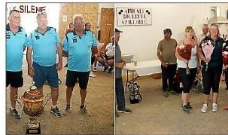
Les finalistes et les féminines de ces Départementaux.

Le samedi 28 mai s'est déroulé le challenge Berrux, Moulis, Tourné en quadrettes.