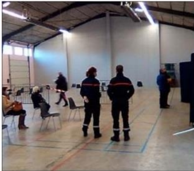
Les équipes mobilisées toute la journée.

Si tu ne vas pas au vaccin, le vaccin viendra à toi ! Pour la 3 e fois, la population était invitée à se faire vacciner au foyer municipal transformé pour l'occasion en centre éphémère de vaccination.