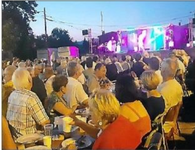
Le village a connu trois jours de festivités début août.

Le village a renoué avec sa traditionnelle fête estivale