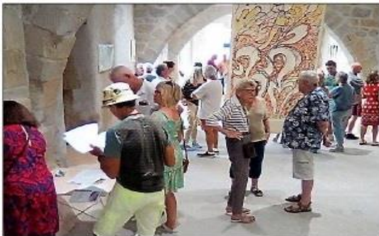
Exposition Nature universelle.

Le 15 juillet s'est déroulé le vernissage de la 3 e exposition organisée par Azille accueil, animé par le trio Jinx jazz-band venu tout droit de Barcelone jouer du jazz traditionnel devant plus d'une cinquantaine de personnes.