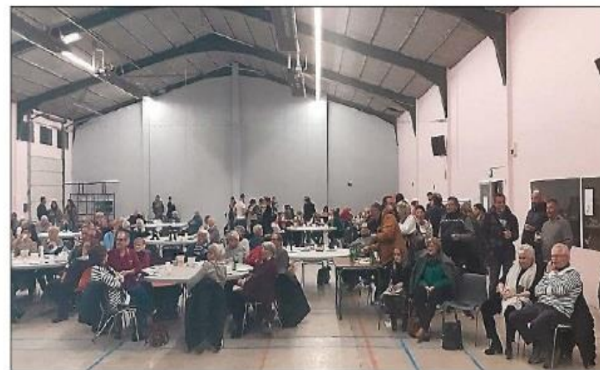
Les habitants ont répondu présent pour la solidarité en faveur de l'Ukraine.

La MJC tient à saluer tous ces partenaires, dont l'atelier chants de Mirepeisset, les as-