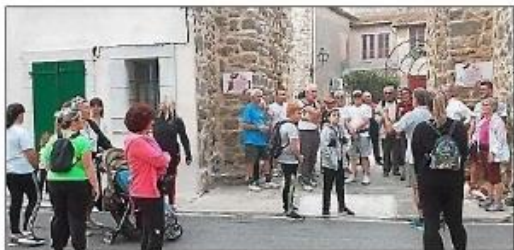
Plus de 50 personnes ont participé à l'événement.

La première édition de sensibilisation au dépistage du cancer du sein a eu lieu dimanche 16 octobre.