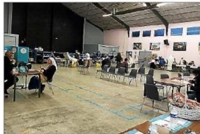
Collecte du don du sang au foyer d'Azille.

Le mardi 20 décembre dernier l'Établissement français du sang a organisé une collecte de sang au foyer municipal. En cette fin d'année, les stocks de produits sanguins sont très insuffisants. Il manque actuellement en France plus de 1 500 dons de sang par jour. Cette fois encore, la mobilisation a été forte. Les donateurs ont répondu positivement à l'invitation : 56 personnes se