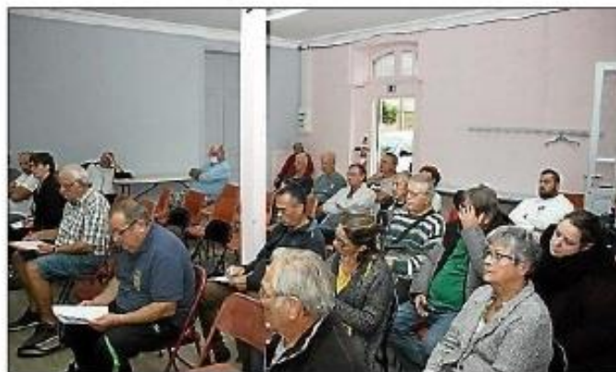
L'assemblée générale s'est tenue en présentiel. Depuis 3 ans, elle avait lieu en visio.

des jeunes, a ensuite pris la parole et décrit les efforts faits afin d'intéresser les jeunes. Le calendrier 2022-2023