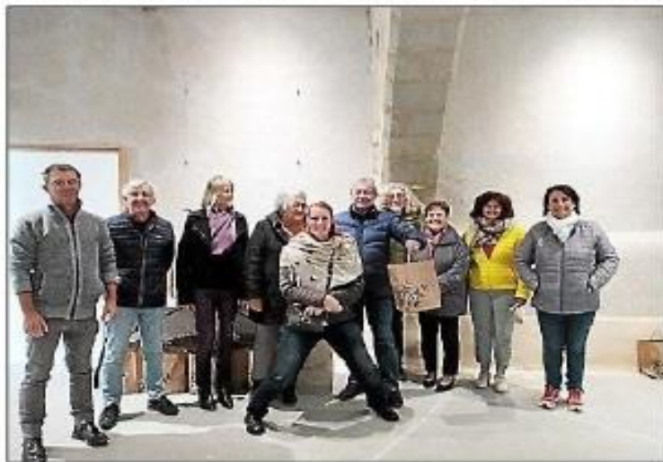
Lors de la distribution des colis de Noël.