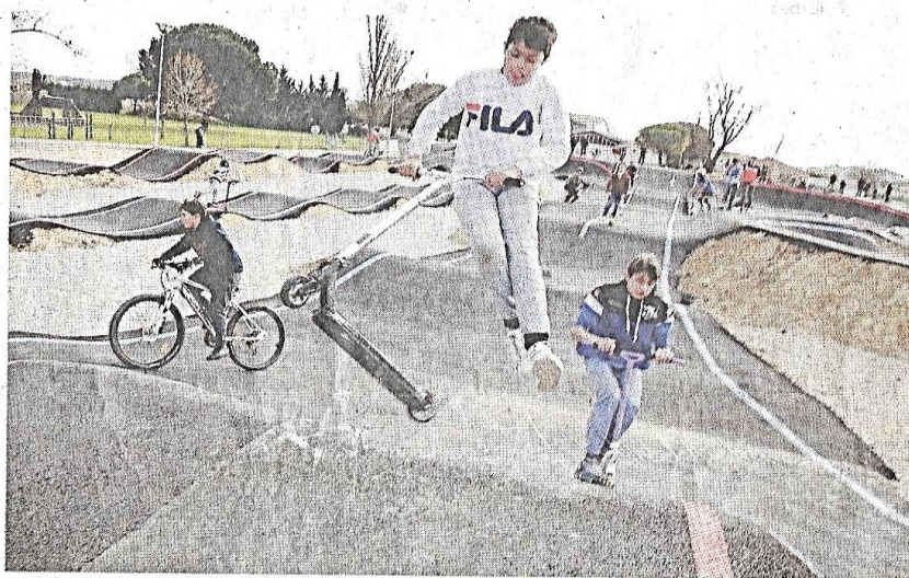
Sur le pumptrack de Cuxac-d'Aude.

offrent du plaisir et des sensations en quelques minutes, pour les plus doués, ou en quelques heures pour les débutants. Autre avantage, pour les comptes publics, un pumptrack en enrobé coûte entre 70 à 100 euros le mètre carré, et n'occasionne aucun frais de fonctionnement sinon l'entretien habituel de l'espace public. Quelques mois après Quillan, le 17 février 2019, Coursan inaugurerait donc à son tour son pumptrack, qui était alors le plus important d'Occitanie, et qui avait