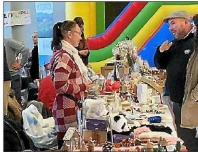
Lors du marché de Noël à Azille.

C'est dans une ambiance chaleureuse et empreinte de féerie que s'est déroulé samedi 10 décembre le marché de Noël organisé par l'association des petits écoliers au foyer municipal d'Azille. Une vingtaine de créateurs et artisans était au rendez-vous.