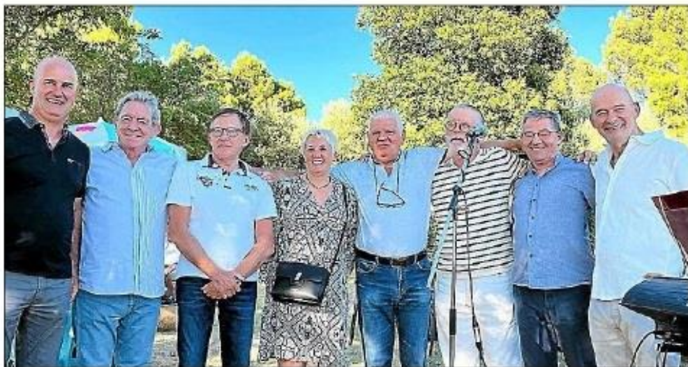
Les représentants du SMAJ et les élus locaux.

Mercredi 27 juillet, la nouvelle guinguette a inauguré officiellement son ouverture en présence des représentants du Syndicat mixte du lac de Jouarres (SMAJ), de la communauté de communes de Lézignan, des élus locaux et des maires des communes voisines, Homps, Azille, Olonzac, Pépieux. Le président du SMAJ a souligné le travail collectif et l'ambition commune qui ont permis la réouverture de cet établissement qui, au-delà de son activité principale de bar restaurant, trouve toute sa place dans le paysage cul-