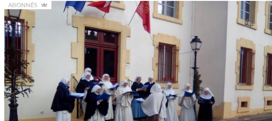
Chants de Noël interprétés par les sœurs du monastère d'Azille.