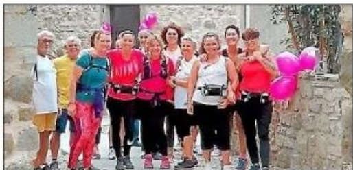
Trois circuits étaient proposés.

Les dons récoltés seront reversés à la Ligue départementale de lutte contre le cancer.