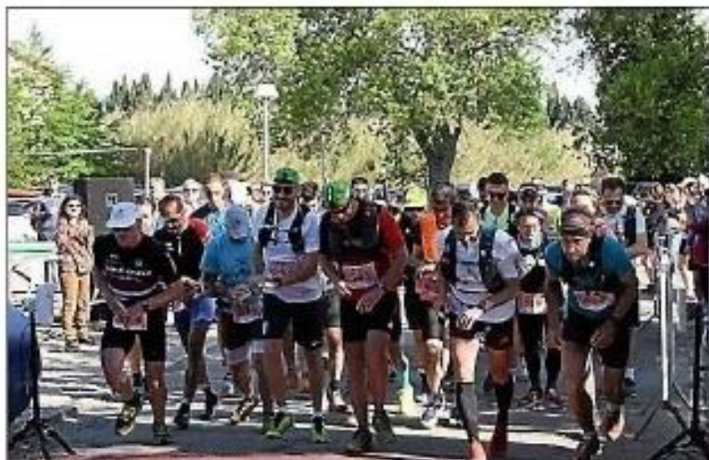
Lors du départ de l'épreuve.

cette année, l'ultratrail du Minervois de 82 km traversant 4 villages (Siran, Cesseras, La Livinière et Azille) et les départements de l'Aude et de l'Hérault avec un tracé qui a marqué les organismes avec les trente premiers kilomètres parcourus sur du plat qui ont exigé une bonne gestion de l'effort.