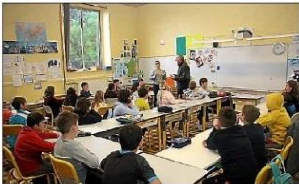
Intervention de l'association du Souvenir français.