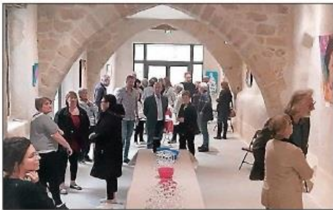
Vernissage de l'exposition «Couleurs femmes».

Dans son travail, c'est le corps de la femme qui est magnifié. A partir d'une émotion, d'un sentiment, le tableau se construit. Acrylique ou huile, couleurs ardentes ou plus sobres, l'œil du visiteur passe d'un tableau à l'autre avec bonheur. L'exposition est ouverte à la salle des voûtes jusqu'au 28 mai 2022 les mardis, vendredi et samedi de 9 h à 12 h et de 14 h à 17 h et les mercredis et jeudi matin de 9 h à 12 h.