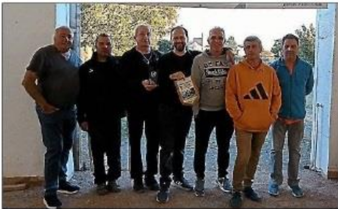
L'équipe de pétanque azilloise.

L'équipe de pétanque azilloise, dotée d'un titre de champion de l'Aude 3 e division en interclubs s'est qualifiée pour les 8 e de finale en battant celle de Névian. En quart de finale, elle s'est imposée devant l'ASCN de Narbonne. Les voilà partis en finale à Tuchan. Plus que jamais motivée avec leur slogan : « Pas de quartier, une finale ça se gagne », l'équipe d'Azille se propulse donc en 2 e division pour la saison prochaine.