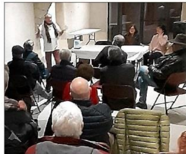
Séquence de dédicace de l'ouvrage, L'épreuve du temps .

Plusieurs temps de lecture de passages du livre ont ponctué cette rencontre et donné l'envie aux auditeurs d'acquiescer le livre. C'est par le pot de l'amitié que ce moment s'est conclu. Souhaitons au livre un grand succès.