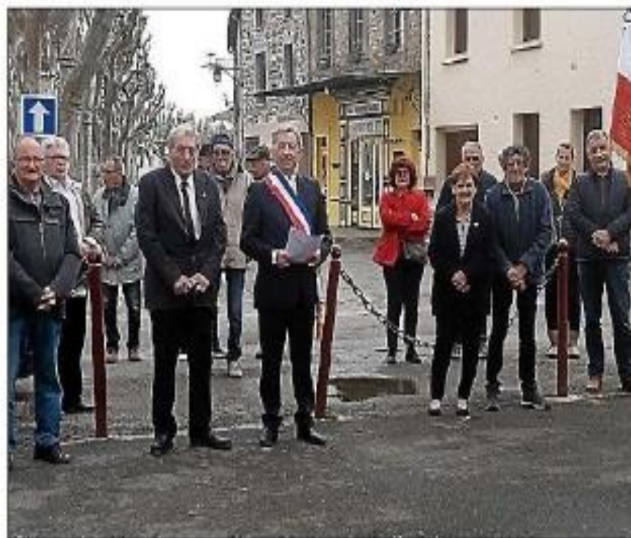
À l'heure des discours.

tants. Le premier magistrat a ensuite procédé à la lecture du discours officiel communiqué par Mme Darrieussecq, secrétaire d'État aux anciens combattants. La commémoration s'est conclue par la Marseillaise interprétée a cappella. C'est enfin autour du pot de l'amitié que tous ont pu se réunir au sein de la mairie, moment privilégié pour se retrouver et pour certains d'évoquer les souvenirs gardés de cette période douloureuse de notre histoire.