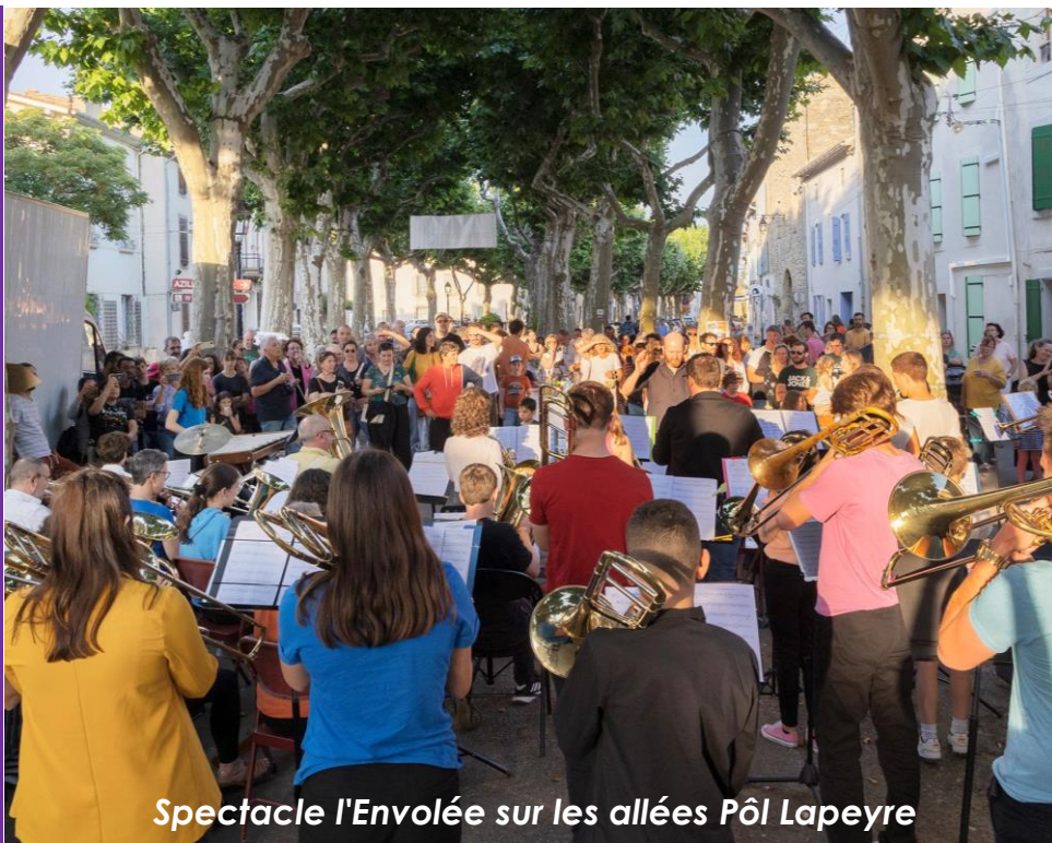
Spectacle l'Envolée sur les allées Pôl Lapeyre