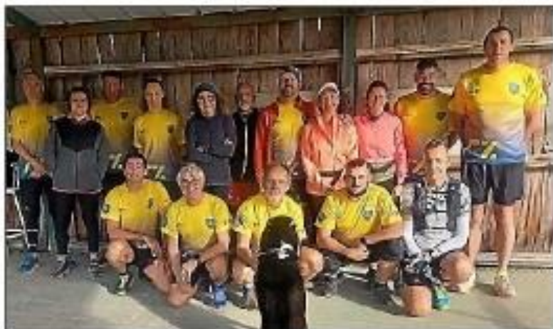
La section prend son rythme de croisière.

La section Course à pied d'Azille Accueil prend son rythme de croisière. Ce dimanche 26 mars, une sortie était organisée en dehors du village.