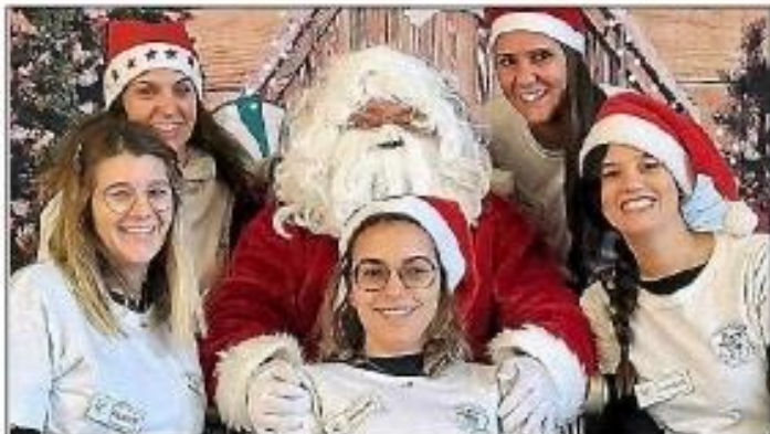
L'équipe de l'association des Petits écoliers azillois.

Comme le veut la tradition, l'association des Petits écoliers se prépare activement pour le marché de Noël annuel qui aura lieu dimanche 10 décembre , au foyer municipal. Cet événement promet de propager la magie de la saison des fêtes.