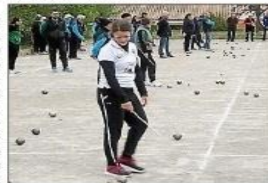
Le championnat s'est déroulé sur le bouldrome de l'ancienne gare.

> Renseignements au 04 68 91 52 28 et au 04 68 91 54 80