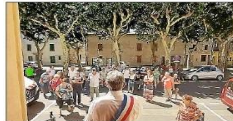
En solidarité envers les élus, les forces de l'ordre, les pompiers et les commerçants : un rassemblement citoyen était organisé par la mairie.