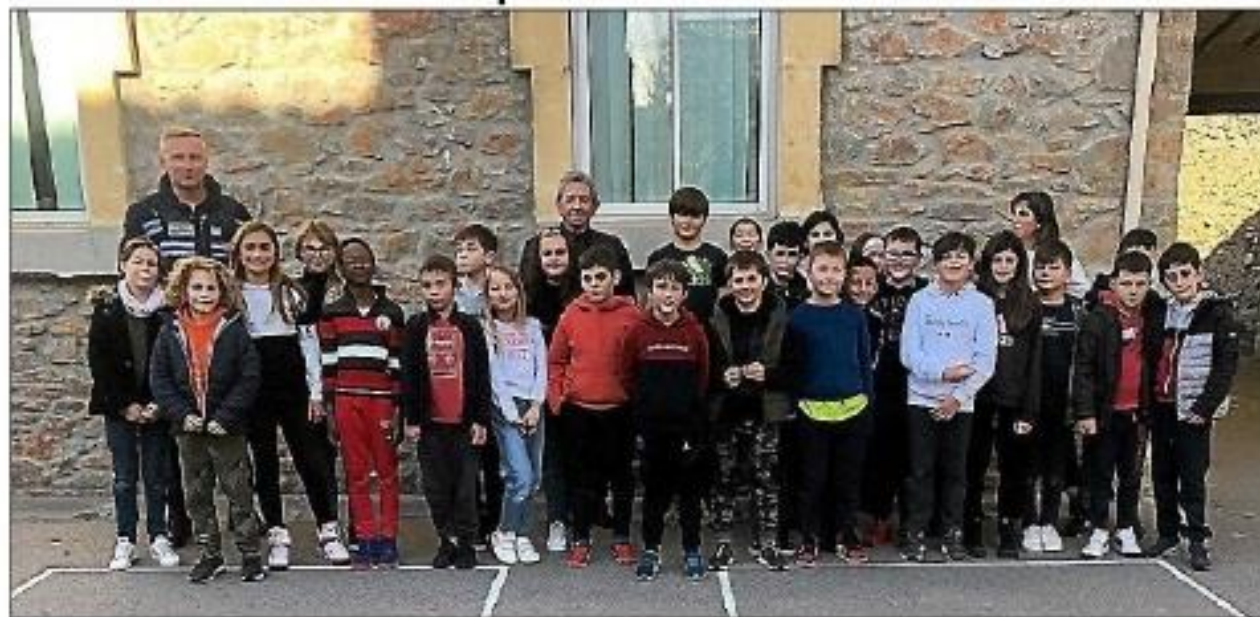
La classe des CM1-CM2 de l'école élémentaire d'Azille.

Mardi 10 janvier, les policiers municipaux sont intervenus à l'école élémentaire, et notamment auprès des élèves de CM1-CM2, pour une action de sensibilisation à la prévention sur la sécurité routière.