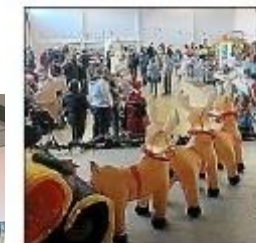
La féerie a rassemblé un large public.

La féerie de Noël, organisée par l'association des Petits écoliers, a rencontré un énorme succès ce week-end. Nombreux ont été les artisans à présenter leurs créations gastronomiques et décoratives, ajoutant une touche de magie à l'atmosphère. Du côté des animations, la féerie était au rendez-vous avec la visite tant attendue du Père Noël, enchantant à la fois petits et grands.