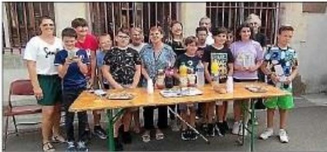
Des calculatrices pour les CM2.

Pour finir, les enfants des classes de CM1 et CM2 ont présenté un spectacle merveilleux intitulé Théâtre d'ombres et lumières en collaboration avec la compagnie théâtrale Silence vacarme de Toulouse. Guidés par Scarlett et Angèle, ces jeunes artistes ont donné vie de manière poétique aux souvenirs qu'ils avaient préalablement