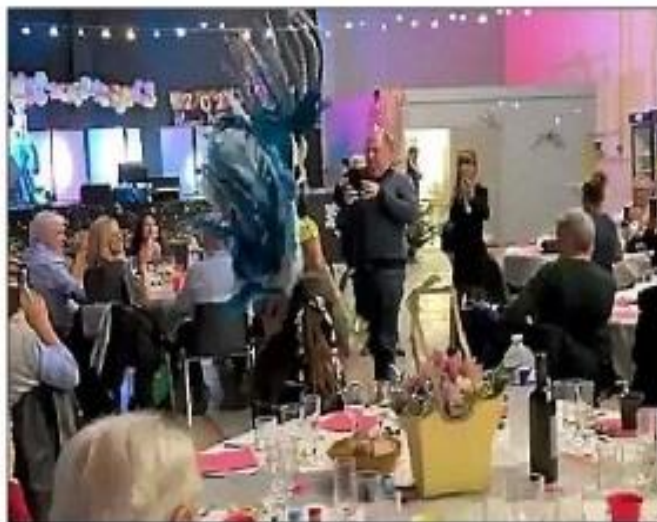
Le réveillon était organisé par la MJC.