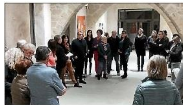
Lors du vernissage de l'exposition.

Les visiteurs ont été plongés dans un univers magique où chaque image racontait une histoire, témoignant d'une créativité collective. La présence des représentants du département de l'Aude, des élus de la commune et des communes voisines, du président du GRAP ainsi que de la Maison des solidarités de Carcassonne, a ajouté une dimension particulière à la soirée,