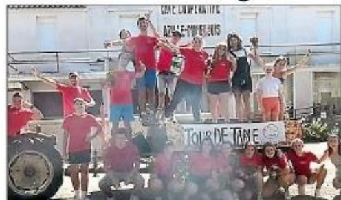
L'équipe du comité des fêtes.

Cette année, la municipalité propose le Jeudi 3 août à partir de 18 h 30 un marché des créateurs, Créazille, dont il s'agira de la première édition. Plus d'une trentaine d'exposants seront présents, offrant une grande variété d'œuvres et de produits. Ce marché permettra aux visiteurs de découvrir le talent des artisans locaux.