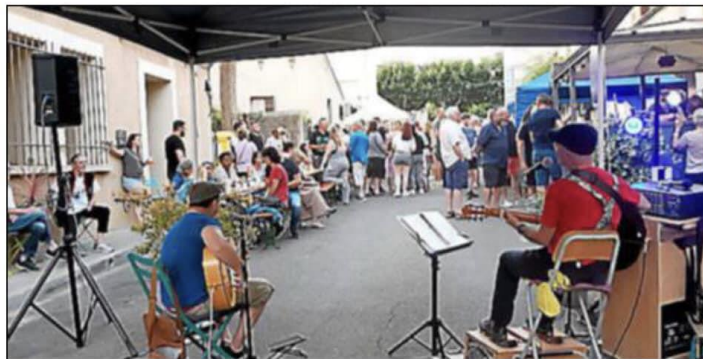
Les musiciens amateurs ont montré leur talent.