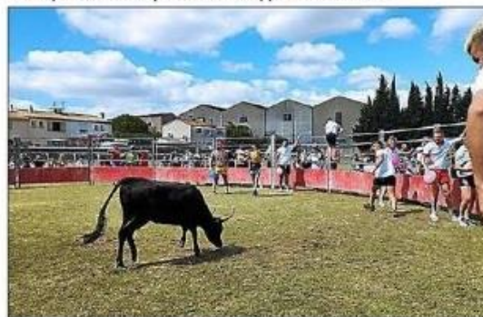
Les jeux intervillages ont toujours du succès.