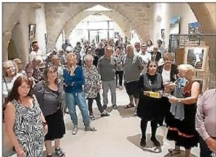
Vernissage le 26 mai de l'exposition des artistes amateurs.

L'art a toujours été une forme d'expression puissante et universelle, permettant aux artistes de partager leurs visions uniques avec le monde. Dans le cadre de la deuxième exposition organisée par l'association Azille accueil, sept artistes amateurs ont pris d'assaut la scène artistique locale avec leurs créations inspirantes et novatrices. Le vernissage de cette exposition, qui a eu lieu le vendredi 26 mai à la salle des voûtes, a été l'occasion pour ces artistes talentueux de présenter leur travail. Avec une diversité de styles, de thèmes et de techniques, ils ont captivé les visiteurs et ont prouvé