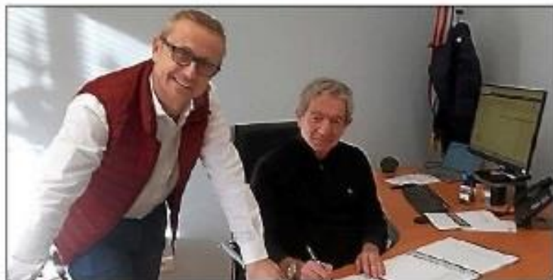
À la mairie.

La gestion quotidienne de la collectivité prend des couleurs