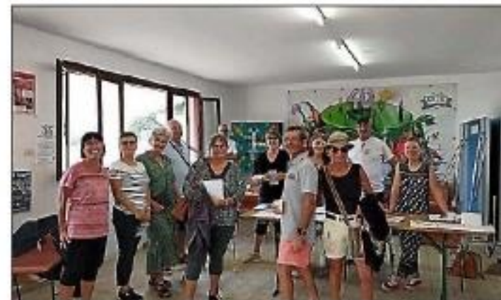
L'équipe de la MJC d'Azille.

La rentrée s'annonce et le samedi 2 septembre de 14 heures à 18 heures, a eu lieu la journée portes ouvertes organisée par la MJC au stade municipal pour présenter les différentes activités qu'elle propose toute l'année.