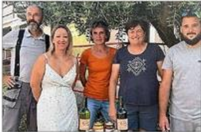
L'équipe de la cave coopérative.

Une démarche qui témoigne de sa volonté de développement tout en demeurant en accord avec ses valeurs fondamentales.