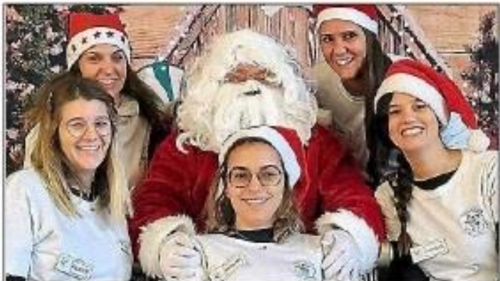
L'équipe de l'association des Petits écoliers azillois.

Comme le veut la tradition, l'association des Petits écoliers se prépare activement pour le marché de Noël annuel qui aura lieu dimanche 10 décembre , au foyer municipal. Cet événement promet de propager la magie de la saison des fêtes.