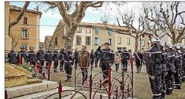
Monument aux Morts à Azille.