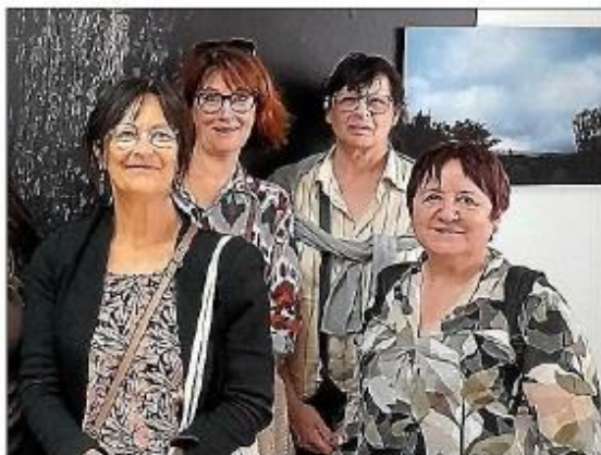
Le collectif « Nos regards croisés ».

Cette exposition est le fruit d'un travail artistique issu d'une initiative collective baptisée « Nos regards croisés », menée au sein de l'antenne de Peyriac-Minervois de la Maison des solidarités de Carcassonne, en partenariat avec le Graph de Carcassonne (Groupe de recherche et d'animation photographique).