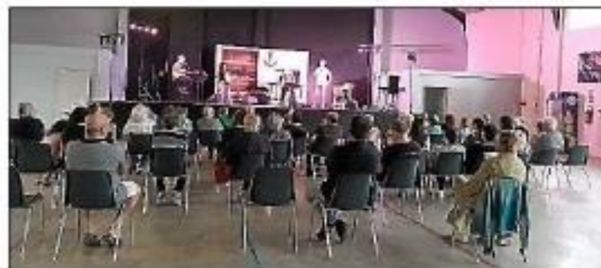
Superbe spectacle de la MJC au foyer municipal.

tacle musical théâtralisé qui a retracé les différentes périodes de la vie de Renaud. L'événement a été ponctué par une vingtaine de chansons, créant un savoureux mélange de tendresse et de passion qui a animé l'ensemble de la soirée.