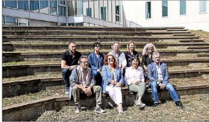
Partenaires et organisateurs réunis pour mettre à l'honneur la culture locale.

Carcassonne Agglo réitère son partenariat avec la Fabrique des Arts, et propose sa nouvelle programmation du festival L'Envolée d'été. Entre nouveaux partenaires et nouveaux spectacles, du 2 au 17 juin les arts de rue feront vivre les villages qui entourent la ville.