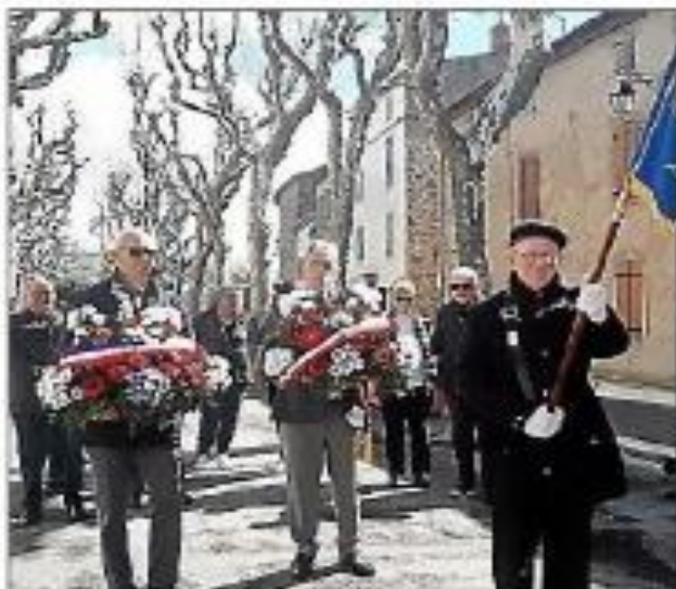
Le cortège se dirige vers le monument aux Morts.