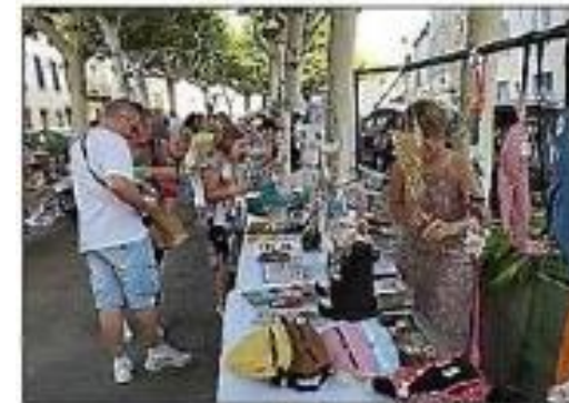
Marché des créateurs, Cré'Azille 2023.

Jeudi dernier, a eu lieu le traditionnel marché des producteurs de l'Aude labellisé par la Chambre d'agriculture de l'Aude et en partenariat avec la ville. Bien que le nombre de producteurs ait été légèrement réduit, la qualité exceptionnelle des produits proposés a su combler les attentes et satisfaire les visiteurs. Tout au long de la soirée animée par Michel Barnabé, les touristes aussi bien que les habitants ont pu savourer les délices du terroir. Simultanément, s'est tenue la première édition du marché des créateurs, Cré'Azille organisé par la municipalité. Une trentaine d'exposants était au rendez-vous pour présenter leurs créations et leur savoir-faire artisanal. Chaque stand a proposé un univers singulier, contribuant à une ambiance chaleureuse. Cette première édition