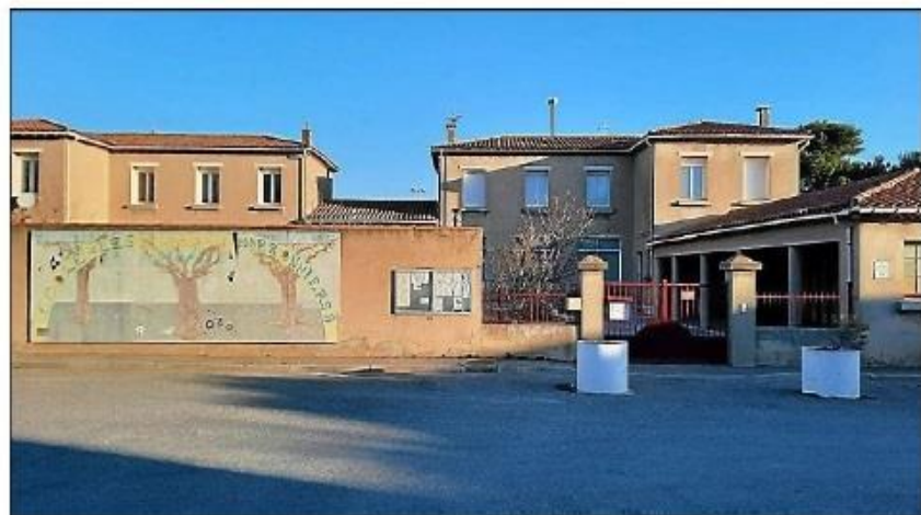
Les parents délégués se mobilisent contre le projet de fermeture d'une classe à l'école maternelle Les marronniers.

En effet, si la fermeture de classe est validée, « il y aura la suppression d'un poste d'enseignant et d'une Atsem. L'accueil des Gran-