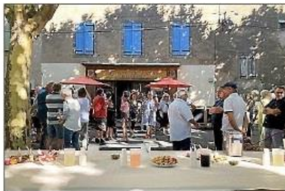
Lors de l'inauguration de L'Air du temps.