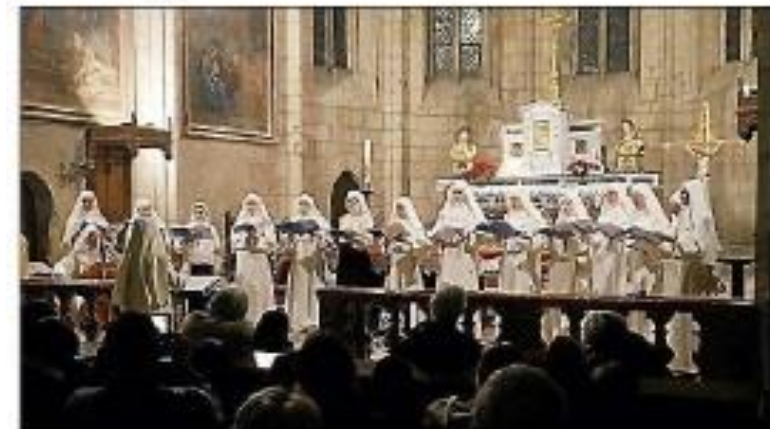
Les sœurs d'Azille interprètent des chants de Noël.

Un récital de Noël suivi de partage autour d'un vin chaud