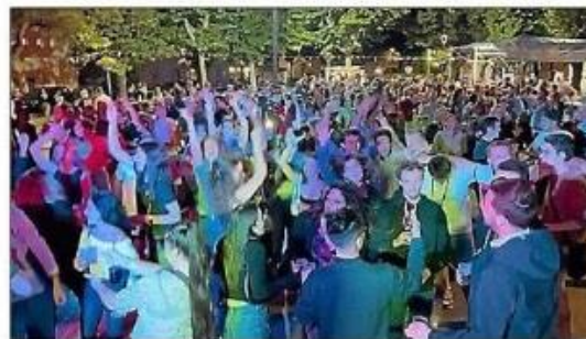
Sur la piste, beaucoup de monde a apprécié l'ambiance.