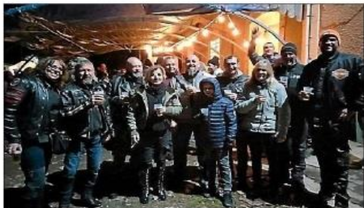
Tous ont pris rendez-vous pour la 33 e édition.

Au retour de celle-ci, le Moto club Picrate a procédé à la remise des prix autour d'un vin d'honneur offert par la municipi-