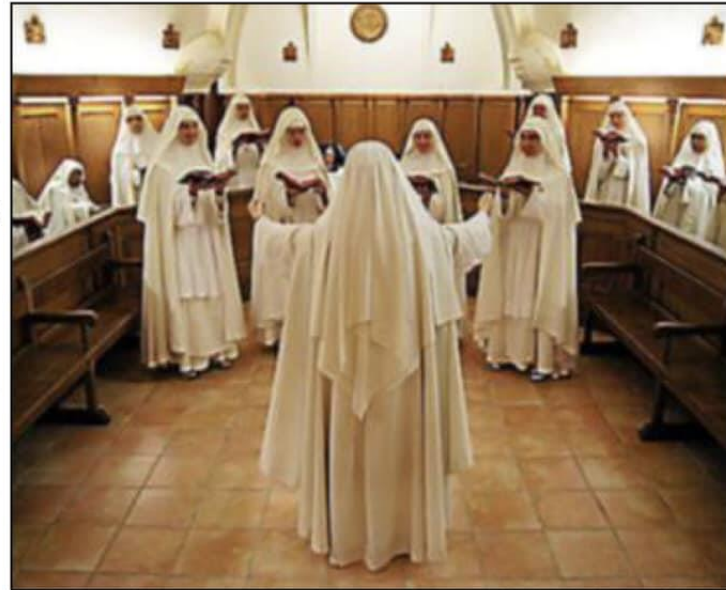
Les sœurs du monastère du village.

L'entrée est libre et vous êtes conviés pour partager cette fin d'après-midi empreinte de l'esprit de Noël.