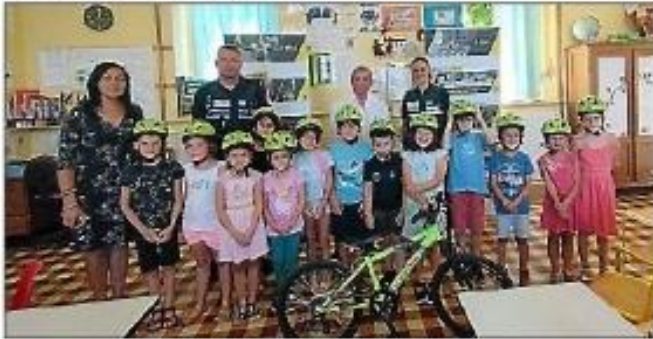
Des casques de vélo pour les CP et CE1.