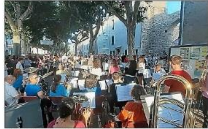
Les cuivres du conservatoire de Carcassonne Agglo.