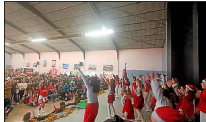
La Féerie de Noël, spectacle zumba kids.