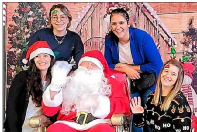
L'association des Petits écoliers d'Azille.