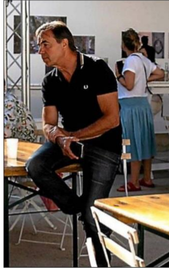
Bruno Vialaneix, photographe.

> Pour toutes autres informations, contact au 04 68 91 59 61. Les jours et horaires d'ouverture sont les suivants : mardi, jeudi, vendredi et samedi de 9 à 12 heures et de 14 à 17 heures, et le mercredi de 9 à 12 heures.