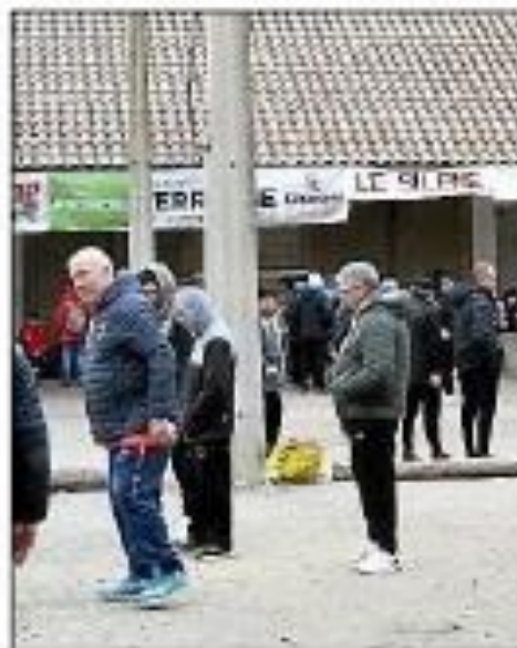
Premier tour de qualification à Azille.

Il convient de souligner que les équipes victorieuses lors de cette compétition auront l'honneur d'obtenir leur qualification pour le championnat de France.