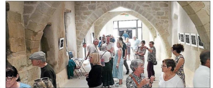
Vernissage de l'exposition « Brûlures ».

Le vice-président du GRAPH a ensuite pris la parole pour présenter l'association qui soutient activement le rôle social de la