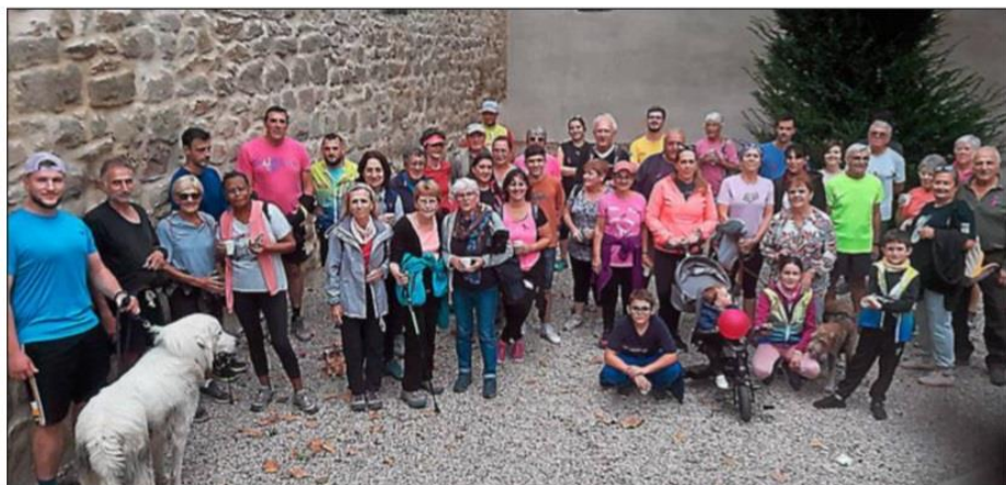
Une belle mobilisation pour Octobre rose.

11 km soit le circuit de randonnée dit « du Petit Baigneur » ou une belle balade de 6 km balisée pour l'occasion étaient donc au menu cette année. Pour les plus petits, un circuit sur les allées P.-Lapeyre a permis à une quinzaine d'enfants de partici-