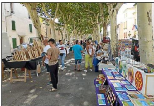
Marché des créateurs.

La commune est heureuse d'annoncer le retour du marché de créateurs Cré'Azille, ainsi que le marché des producteurs, qui se tiendront le jeudi 1 er août à partir de 18 heures. Ces deux événements incontournables mettront en lumière l'artisanat local, les talents artistiques, et le savoir-faire des travailleurs indépendants de la région, ainsi que les produits locaux de qualité. Au fil de la promenade, on pourra composer son menu au gré de ses envies et déguster en toute convivialité sur des tables mises à disposition. Une buvette sera également présente sur place. Le marché des producteurs sera animé par le groupe Gatechin. Par la même occasion, le vendredi 2 août , une soirée spectacle Les copains Twists est organisée, suivie du feu d'artifice de la commune au stade municipal, pour se terminer en beauté avec DJ Nina show. Le samedi 3 et le dimanche 4 , la fête continue dans un esprit feria avec concours de pétanque, des spectacles aux arènes, des jeux Intervilles, des taureaux piscine, et le DJ Geoffrey Not pour les deux jours.