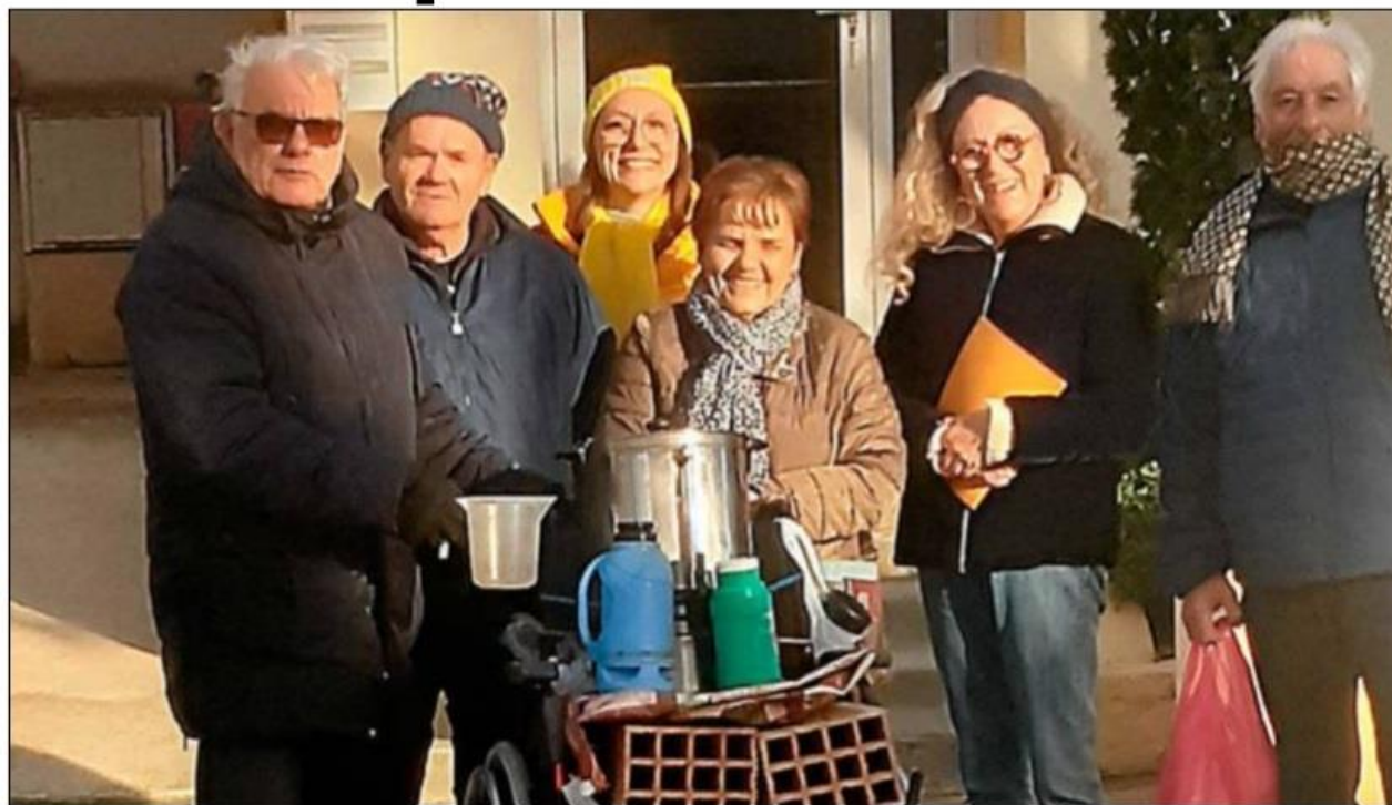
L'équipe organisatrice du vide-greniers en faveur du Téléthon.

Le point d'orgue de cette mobilisation a eu lieu dimanche 15 décembre, avec un vide-greniers organisé par la municipalité. Les participants et visiteurs, venus nombreux, ont contribué à cette belle initiative solidaire. Grâce à l'urne et aux dons collectés lors de cet événement, 590 € ont été remis au profit du Téléthon. Une belle somme, fruit de la solidarité des Azillois