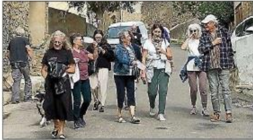
Déambulation pour une immersion dans le passé.

L'après-midi, dès 14 heures, une déambulation à travers le village a permis aux participants de découvrir le nouveau sentier du pa-