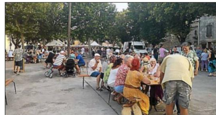
Marché des producteurs de l'Aude.