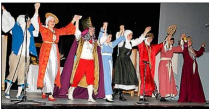
Les sœurs chanoinesses.

Avec une mise en scène à la fois audacieuse et respectueuse du texte original, les sœurs ont su captiver aussi bien les amateurs de théâtre que les curieux venus nombreux. Leur interprétation