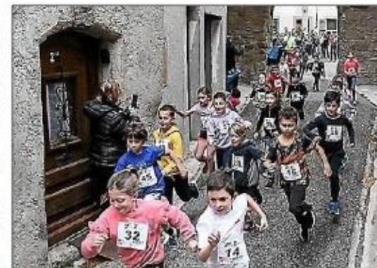
La belle énergie des enfants dans les rues du village.

La participation 2024 Tra'zille a connu une belle progression par rapport à 2023. C'est ainsi que sur l'Ultra trail du Minervo 49 coureurs ont fini la course, 130 coureurs sur le Petit baigneur, 60 coureurs sur La Serre et 17 sur l'épreuve de marche nordique. La randonnée a permis de réunir 22 marcheurs sur une distance de 12 kilomètres et les courses enfants ont eu une belle fréquentation avec 53 enfants qui ont pu courir dans les rues du village. La relève est déjà là ! Ultratrail du Minervo (UTDM) d'une distance de 67 km et un dénivelé + de 2 000 m, a vu la victoire de Benjamin Bernardini qui a bouclé la course en un temps canon de 6 h 02. Jonathan