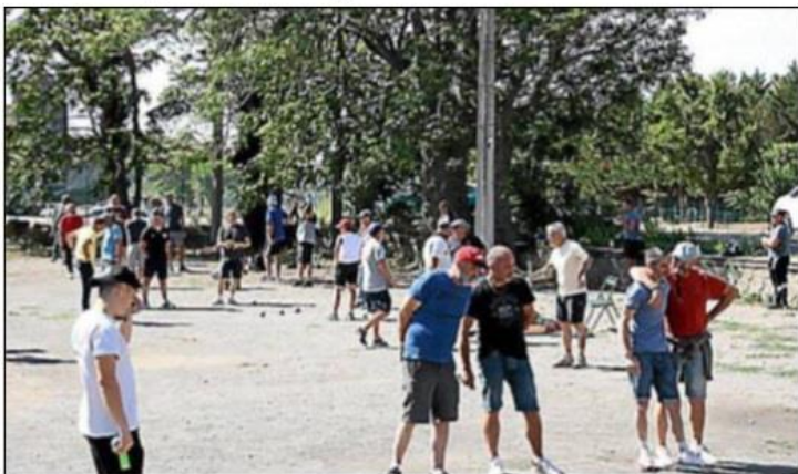
Les 32 triplettes à Azille.