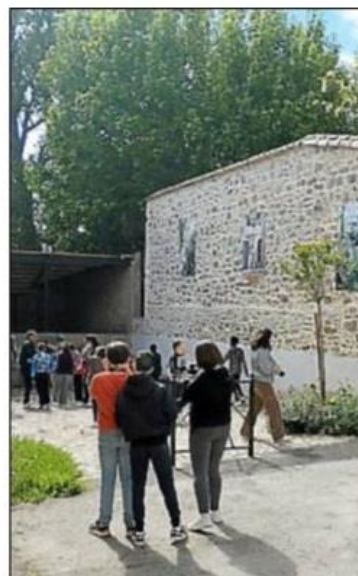
Sortie photo avec les élèves de CM1 et CM2 de l'école élémentaire.