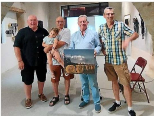
Les trois premiers gagnants du concours photo 2024.

Cette année, la municipalité a reçu 95 photos provenant de 32 participants. Il a également remercié la classe de CM1 et CM2 de Valérie Guiraud ainsi que l'Accueil de loisirs de La Redorte