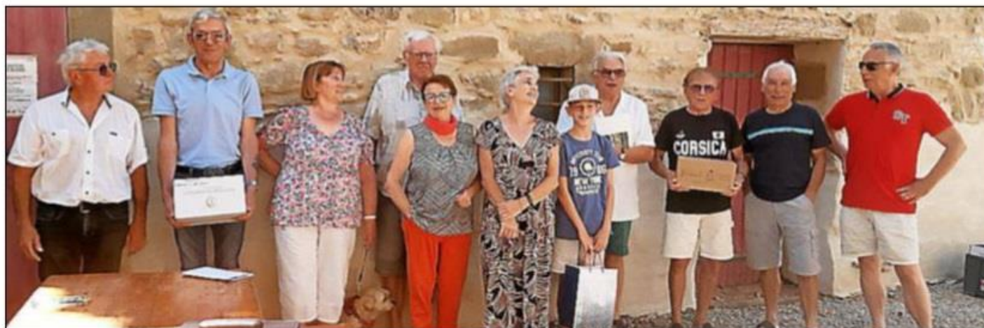
Les gagnants du quiz organisé à l'occasion de la fête nationale.

les deux équipes obtenant le meilleur score ainsi qu'un prix spécial jeune ont été remis par le maire et ses adjoints aux lauréats du jour.