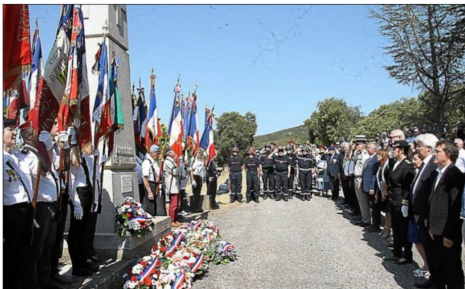
De très nombreuses personnalités étaient présentes pour cette cérémonie.