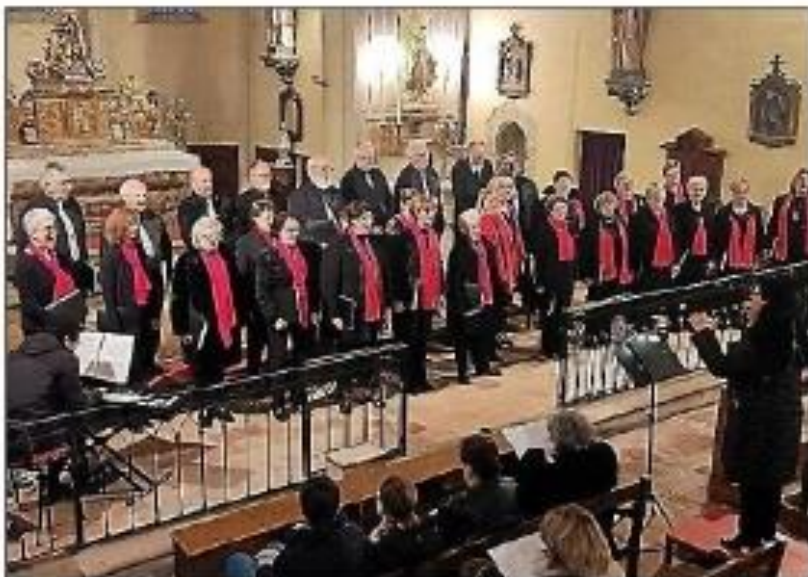
La chorale Vocalises de Palaja.

Cette chorale se produira le samedi 4 mai.