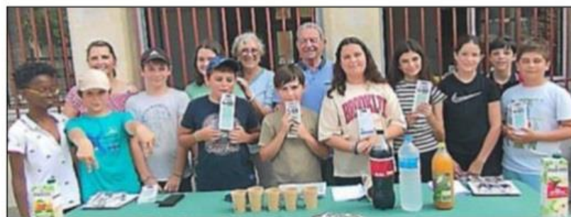
Jeux pour les bambins et remise des calculettes aux futurs collégiens.