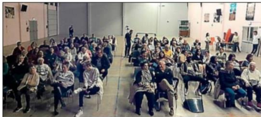
Le spectacle « The new star-lette » a ravi le public.

Aujourd'hui, la compagnie affiliée à la Fédération nationale des compagnies de théâtre amateur (FNCTA), les comédiens ambitionnent de présenter un nouveau spectacle lors