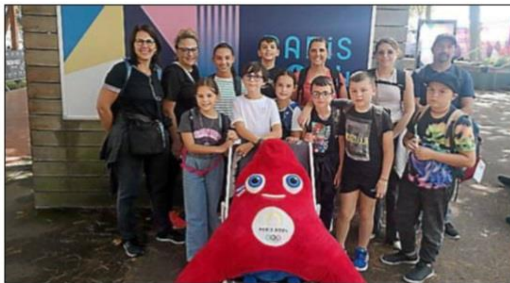
La classe des CM2 d'Azille aux Jeux Paralympiques.