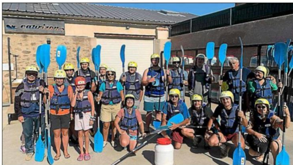
La sortie canoë sous le soleil a été très appréciée de tous.