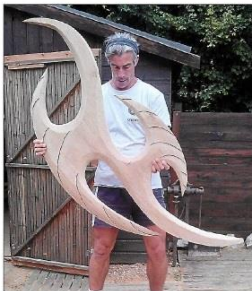
Oliv'ine, avec une de ces réalisations.

> Horaires d'ouverture : lundi, mardi, jeudi, vendredi de 9 heures à 12 heures et de 14 heures à 17 heures, mercredi de 9 heures à 12 heures. Renseignements complémentaires : 04 68 91 59 61.