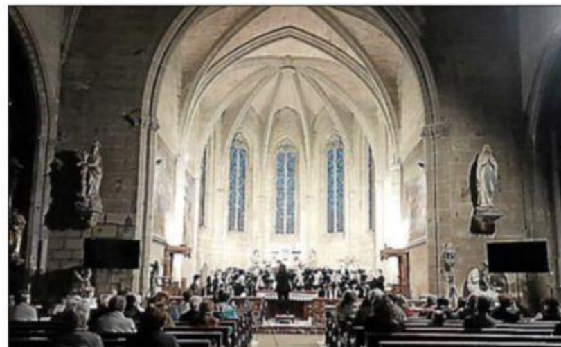
La chorale Vocalises a enchanté le public par sa prestation.