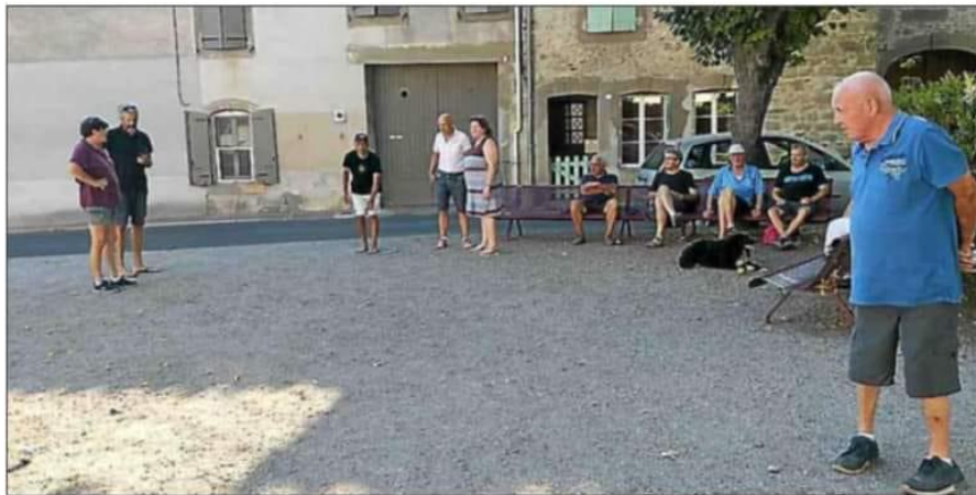
Autour d'une partie de pétanque, les conversations vont bon train.

Autant le dire tout de suite, l'enthousiasme pour les JO 2024 est