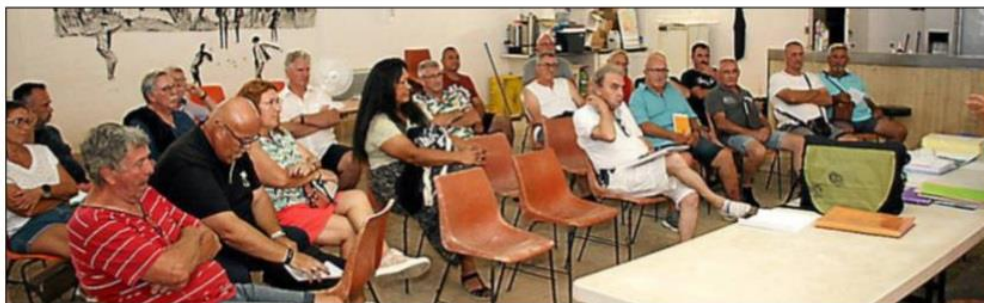
Réunion à Azille pour la nouvelle présidence du comité bouliste de l'Aude.

Cependant, aucune décision finale n'a été prise ce soir-là. En raison de l'absence de consensus, il a été décidé de convoquer