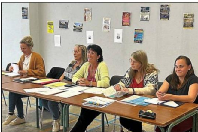
Le bureau de la MJC d'Azille.

Elle a rappelé avec enthousiasme l'objectif principal de la MJC : offrir aux habitants d'Azille et des environs, des plus jeunes aux plus âgés, une large gamme d'événements et d'activités. L'ambition est de rassembler la communauté, de créer des liens solides et de favoriser des moments de convivialité qui enrichissent la vie locale. La présidente a souligné que l'un des désirs les plus chers de l'association est « de renforcer les liens avec les au-