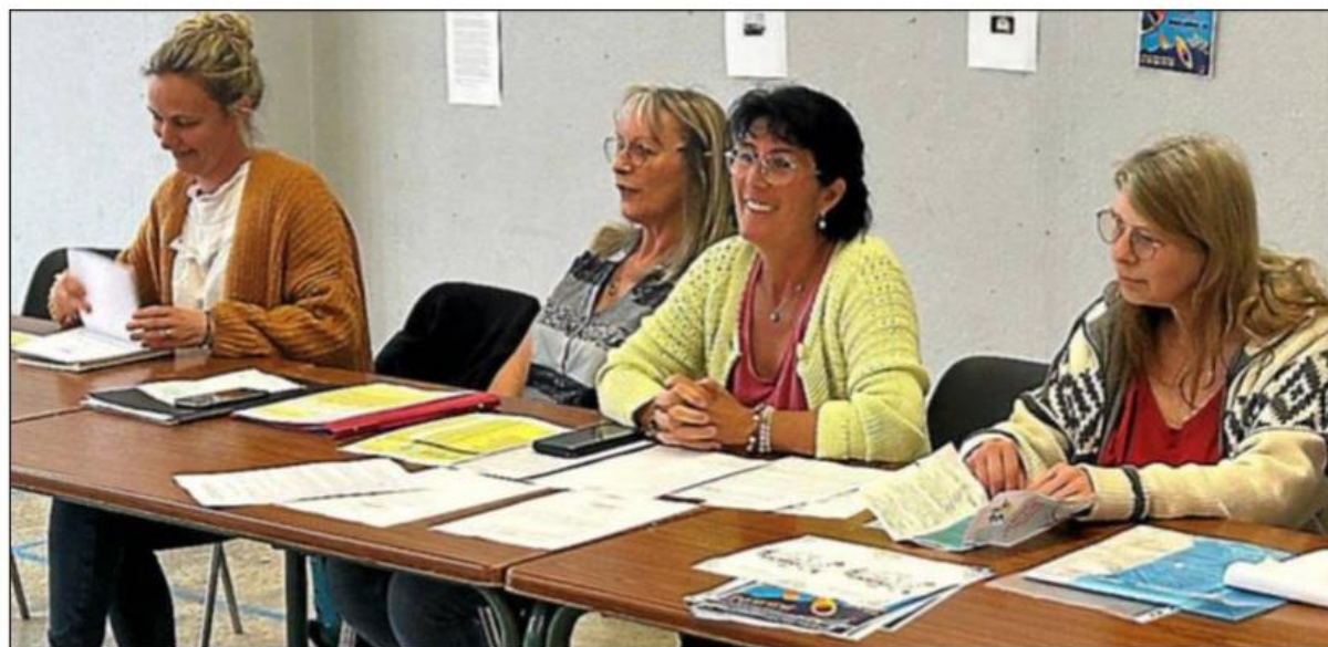
Le bureau s'est réuni pour annoncer les activités de l'année.

le tennis de table et un atelier de bricolage et décoration, sont en attente de créneaux horaires.