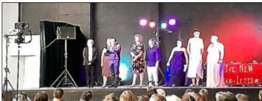
La compagnie sur scène.

La salle des fêtes a vibré au rythme des rires et des applaudissements grâce à la pièce The new star-lette , brillamment interprétée par la compagnie de l'Huître bleue. Ce clin d'œil hilarant de la célèbre émission Star academy a conquis un public de 85 spectateurs, offrant