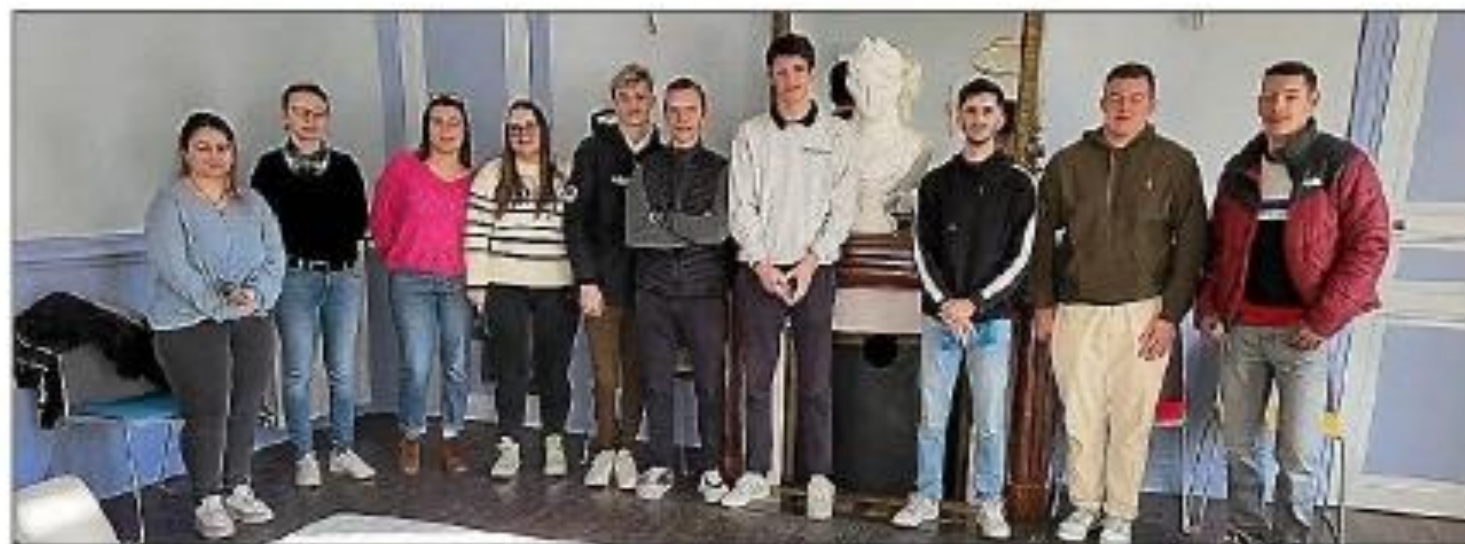
Remise du livret du citoyen aux jeunes Azillois.

celle-ci, assurant une application uniforme du droit à l'ensemble des citoyens sur tout le territoire national. Il a rappelé la laïcité, garantissant la liberté d'opinions et de foi, ainsi que le caractère démocratique de la République, reposant sur le suffrage universel. Enfin, il a mis en avant le caractère social de la République, garant de la cohésion sociale. Le maire a exhorté les jeunes Azillois à respecter et à défendre ces principes qui guideront leur vie de citoyen. Après avoir remis solennellement à chaque jeune Azillois le Livret du citoyen, le maire a invité l'assistance à partager le pot de l'amitié.