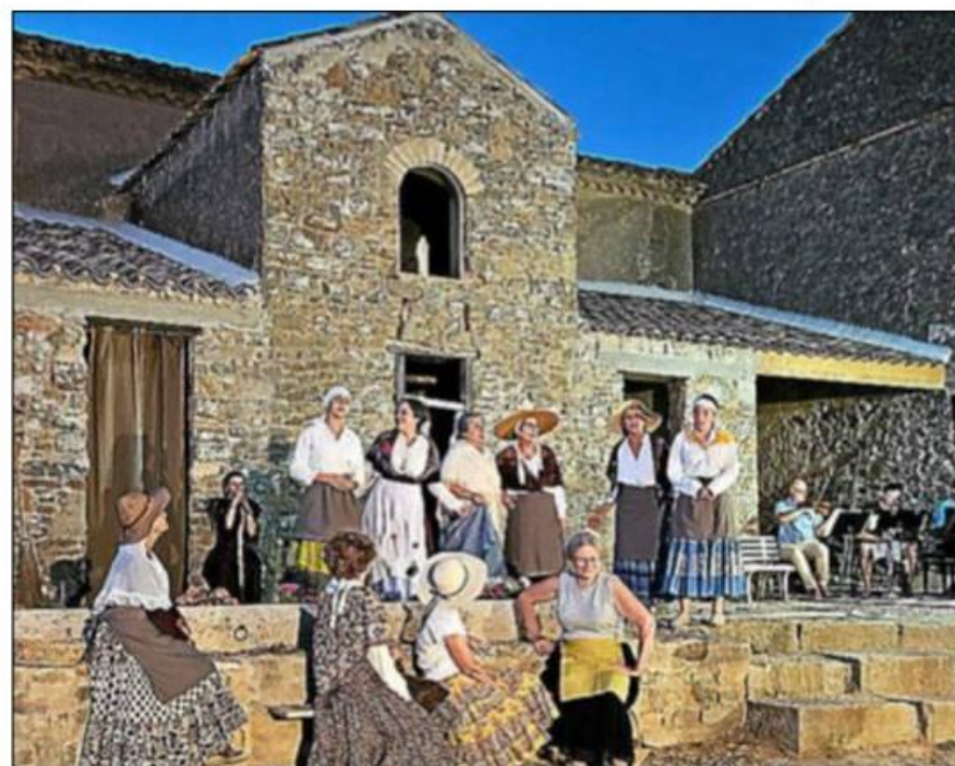
Festival « À ciel ouvert ».