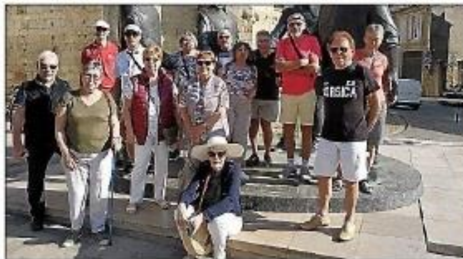
Sortie des Cyclos dans le Gers.

Le secrétaire a ensuite pris la parole pour évoquer la situation du club, mettant en lumière les défis de 2023. Avec seulement 23 licenciés, le club a constaté une baisse d'effectifs, une tendance départementale et nationale. Les raisons évoquées incluent une moyenne d'âge en