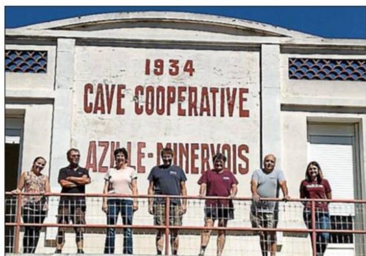
L'équipe de la cave coopérative.

Le nom Caveau du Silène trouve son origine dans une découverte archéologique locale. Une statuette de Silène assis, retrouvée