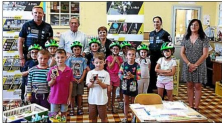
Les élèves de CP et grande section ont reçu des cadeaux.

Avant de recevoir ces cadeaux, les policiers ont rappelé aux enfants l'importance des règles de sécurité à respecter lorsqu'ils se déplacent à pied, à vélo ou à