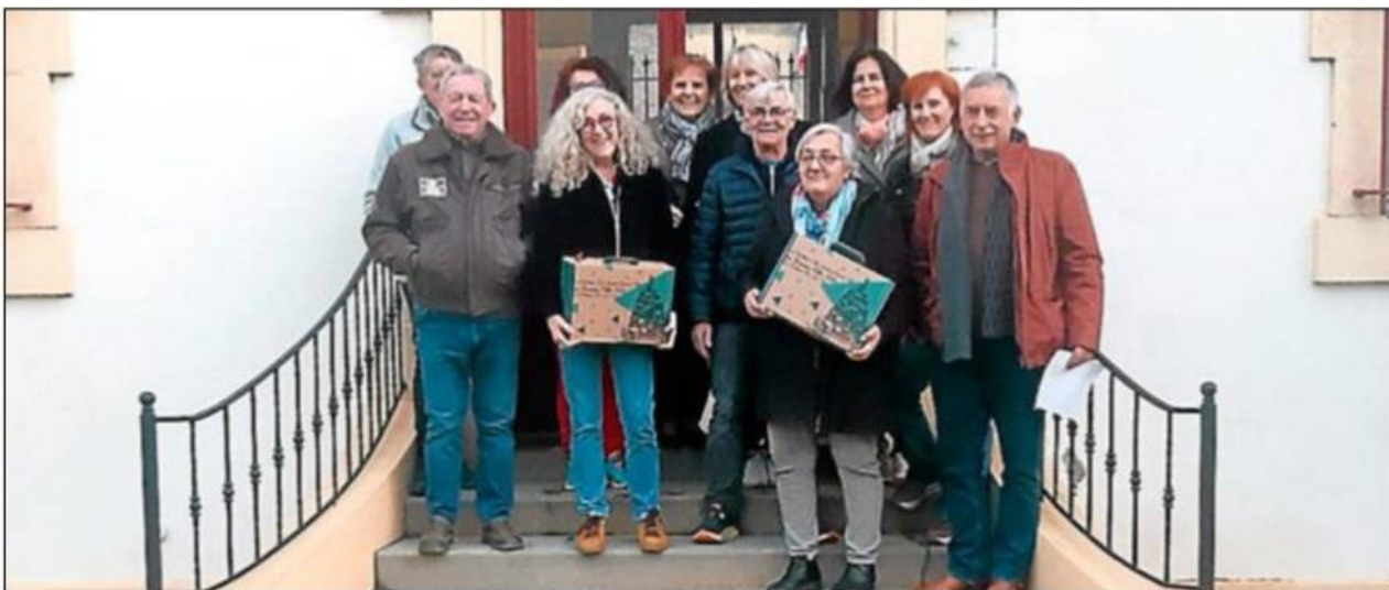
Les élus se sont rendus chez les seniors pour leur remettre les colis de Noël.

> Pour les personnes absentes lors de la distribution, il est possible de récupérer le colis directement à la mairie, aux horaires d'ouverture : du lundi au vendredi, de 10 à 12 heures et de 16 à 18 heures.