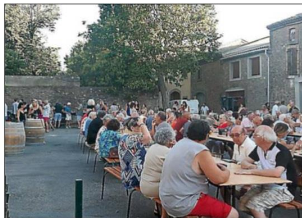
Les invités ont partagé des moments inoubliables.

et conviviale, ponctuée par la dégustation de vins d'exception produits par la cave au fil des décennies. Les allocutions ont également été l'occasion de rendre un hommage émou-