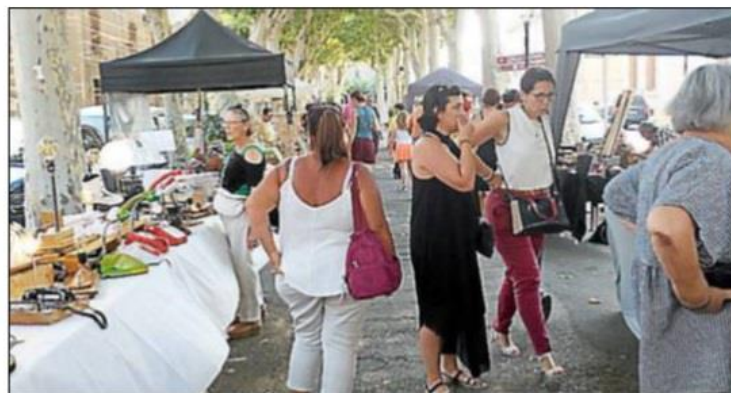
Marché des créateurs « CréAzille ».