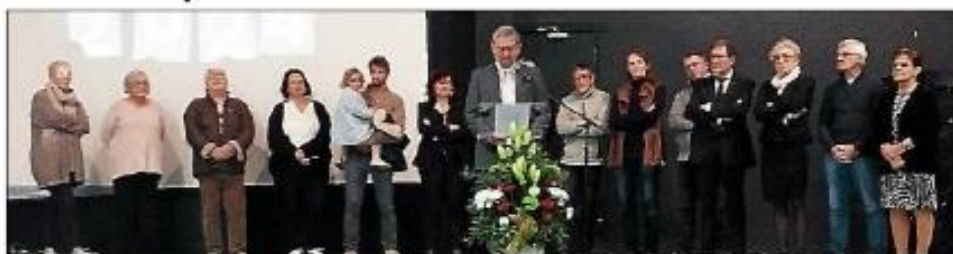
Les élus d'Azille ont adressé leurs vœux à la population.

La cérémonie des vœux s'est déroulée le vendredi 12 janvier. Les habitants, fidèles au rendez-vous, sont venus en grand nombre pour partager ce moment républicain. Une vidéo diffusée en boucle a mis en lumière les événements marquants de 2023, tant du point de vue de l'action municipale que celle des acteurs économiques et associatifs de la commune.