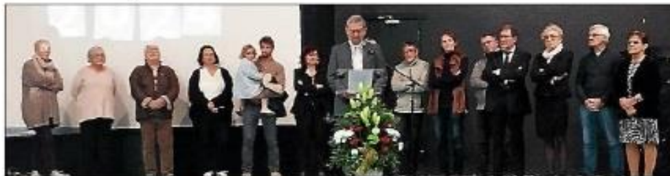
Les élus d'Azille ont adressé leurs vœux à la population.

La cérémonie des vœux s'est déroulée le vendredi 12 janvier. Les habitants, fidèles au rendez-vous, sont venus en grand nombre pour partager ce moment républicain. Une vidéo diffusée en boucle a mis en lumière les événements marquants de 2023, tant du point de vue de l'action municipale que celle des acteurs économiques et associatifs de la commune.