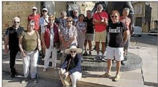
Sortie des Cyclos dans le Gers.

Le secrétaire a ensuite pris la parole pour évoquer la situation du club, mettant en lumière les défis de 2023. Avec seulement 23 licenciés, le club a constaté une baisse d'effectifs, une tendance départementale et nationale. Les raisons évoquées incluent une moyenne d'âge en