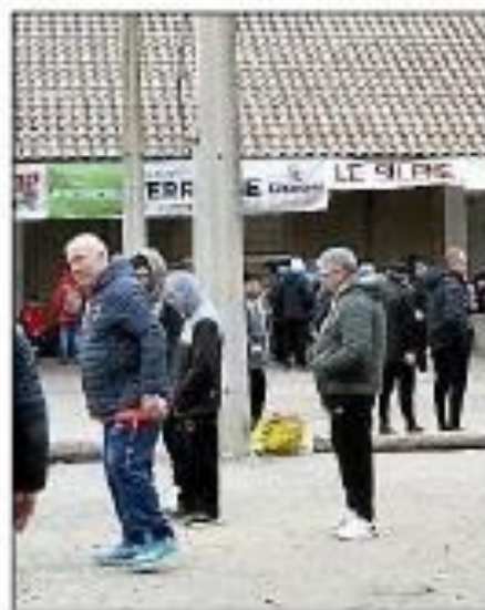
Premier tour de qualification à Azille.

Il convient de souligner que les équipes victorieuses lors de cette compétition auront l'honneur d'obtenir leur qualification pour le championnat de France.